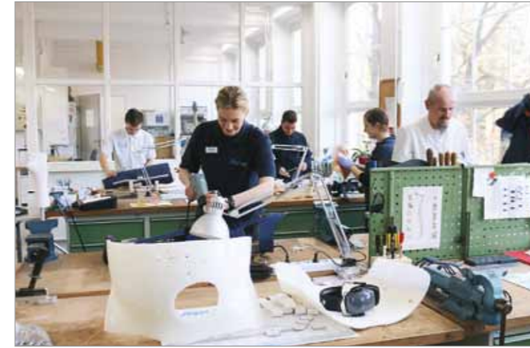
Blick in die hellen Räume der orthopädischen Werkstatt