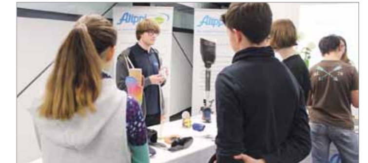
Gespräche mit unseren aktuellen Azubis brachten viele Informationen und Erkenntnisse im ubineum.

Ein praxisnaher Einblick in die Ausbildungsberufe ist immer noch die beste Werbung und Möglichkeit, Informationen zu sammeln. Im ubineum gaben die Auszubildenden der vier Berufsgruppen den Jugendlichen ihre Kenntnisse weiter und in der orthopädischen Werkstatt in Zwickau stellten wir vor über 20 Interessenten den Ausbildungsberuf Orthopädietechnik-Mechaniker/-in vor. Werkstattbesichtigungen und Fertigungstechniken veranschaulichten die Vielseitigkeit des Berufs.