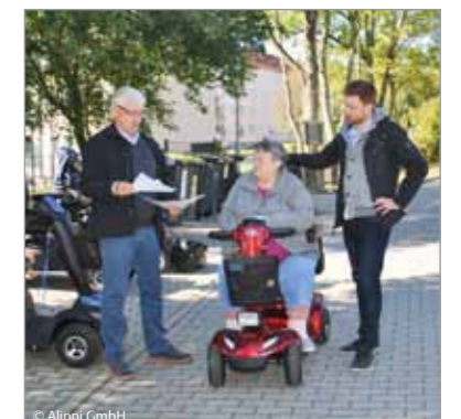
Studie: Alltagsmobilität in Marienthal