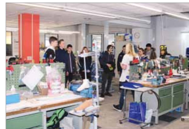
Ein Besuch vor Ort ist praxisnah und immer noch die beste Art, einen Beruf kennenzulernen.

An Sachsens größter Initiative zur Berufsorientierung beteiligten auch wir uns in diesem Jahr wieder, weil wir in den vergangenen Jahren gute Erfahrungen damit gemacht hatten. In der Woche vom 11. bis 15. März 2019 luden sachsenweit Unternehmen Jugendliche und Schüler ein.