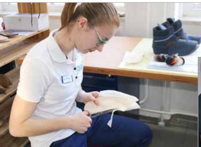
Auszubildende beim Beziehen einer Korkeinlage