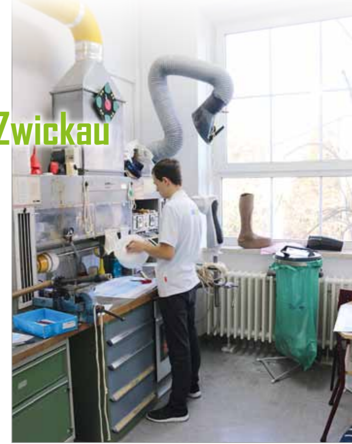
Weiterverarbeitung einer Orthese im Gießharzraum