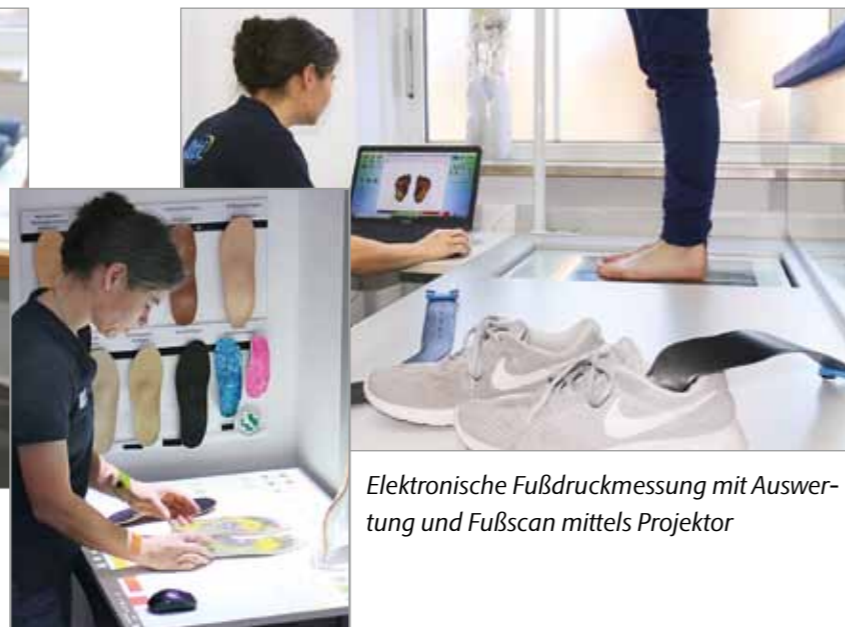
Elektronische Fußdruckmessung mit Auswertung und Fußscan mittels Projektor