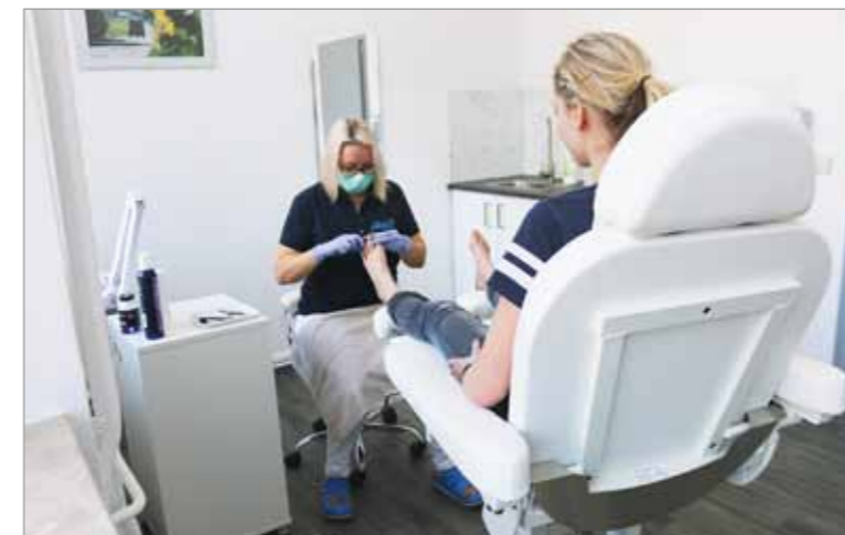
Alles bestens eingerichtet für podologische Behandlungen

Die räumliche Nähe und die Zusammenarbeit aller Bereiche bieten Vorteile in der Anschlussbehandlung der Patienten – ein Service für unsere Kunden, den wir als Partner auf dem Klinikgelände anbieten können.