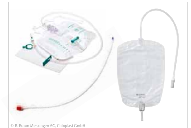
Hilfsmittel zur ableitenden Inkontinenzversorgung

Denn hier kommen weitere Versorgungsmöglichkeiten wie Katheter mit Bein- oder Bettbeuteln zum Einsatz.