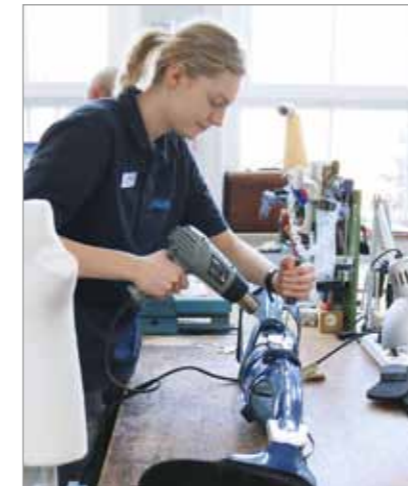
Lösen einer Schraubverbindung