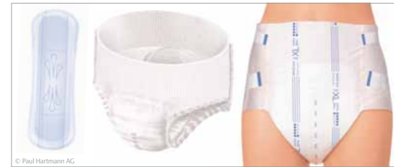
Verschiedene Varianten zur aufsaugenden Inkontinenzversorgung

Sie erhalten auf Wunsch nach der Beratung kostenlose Muster. Sie können danach entscheiden, welche Versorgung am angenehmsten für Sie zu tragen ist.