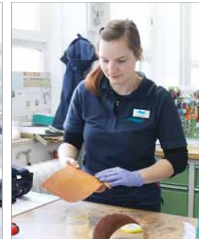
Lederbehandlung mit Schellack

arbeiter an der Werkbank, im Schleif- oder Gießharzraum.