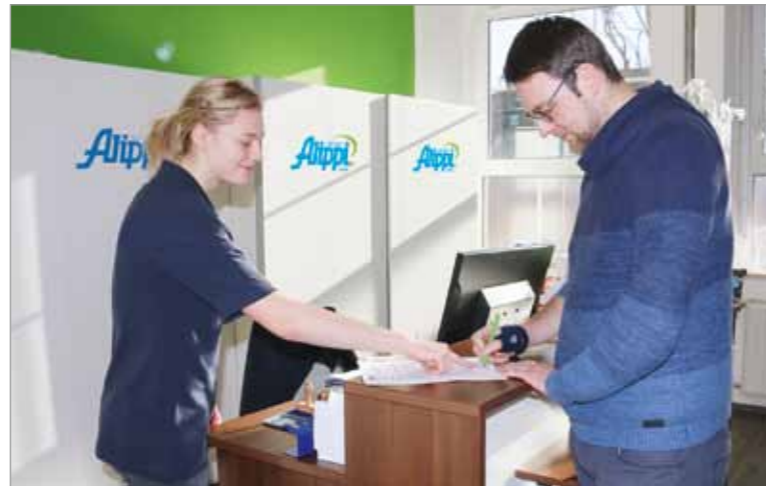
Ein klassisches Sanitätshaus-Sortiment halten wir ebenfalls vor.