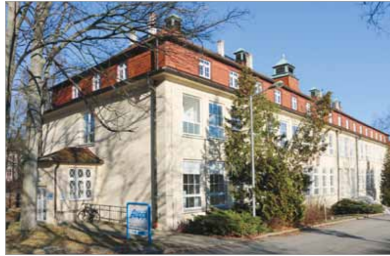
Das Haus 90 auf dem Klinikgelände mit unserer Filiale über zwei Etagen

Neben einem geräumigen und modernen Sanitätshaus mit Kabinen und dem Behandlungs- und Sterilisationsraum der Podologie stehen ein Schulungsraum (genutzt auch zur Skoliose-sprechstunde im Klinikum) und verschiedene kleinere Arbeitsräume zur Verfügung. Begeistert waren wir von der Technik der Fußdruckmessung mit Fußscan, dessen Bilder mittels Projektor auf einer weißen Fläche übereinandergelegt werden können und die Daten des Fußes somit direkt auf den Einlagenrohling übertragen werden. Diese Technik ist einzigartig im Filialnetz. Im Obergeschoss hören wir die vertrauten Geräusche der Werkstatt: Schleifen, Hämmern, Klopfen, Bohren, Fräsen ... und treffen die Mit-