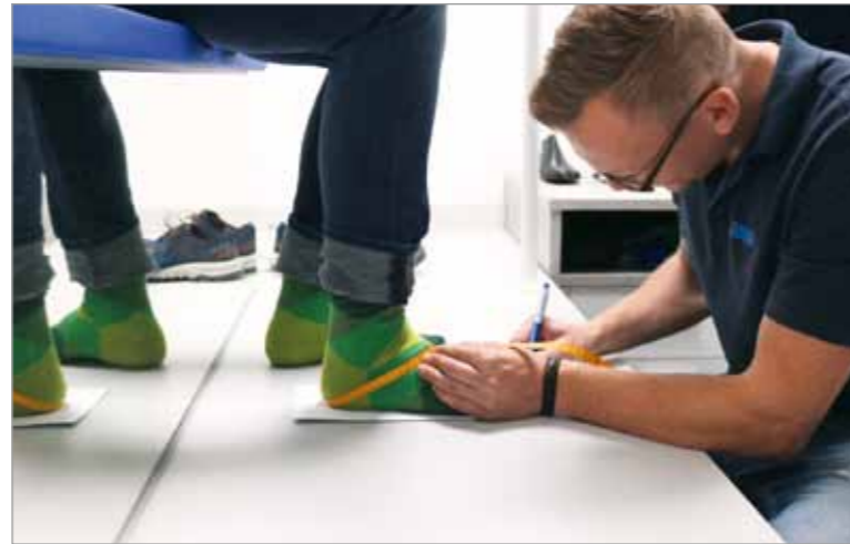
Maßnahmen am Fuß des Kunden nach dem Blauabdruck