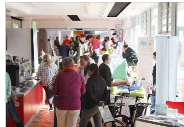
Jeweils sehr gut gefüllt: Hörsaal und Industrieausstellung

Schon Tradition in Zwickau: das Wundsymposium. Inzwischen zum 11. Mal hat das Organisationsteam diese wunderbare Veranstaltung auf die Beine gestellt.