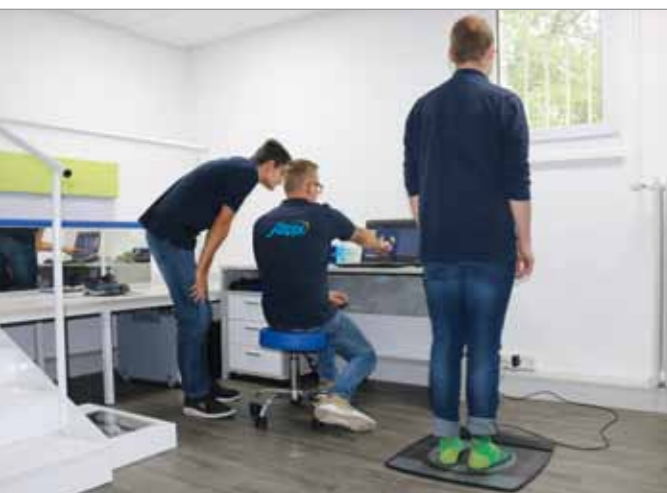
Bei der Fußdruckmessung lassen sich Fußfehlstellungen erkennen

Und nun waren wir mit der Kamera zu Besuch in Chemnitz und haben uns zeigen lassen, wie in der Orthopädienschuhtechnik gearbeitet wird. Begonnen haben wir bei einer Fußdruckmessung und dem Maßnehmen der Füße. Dabei konnte der Meister gleich dem neuen Auszubildenden Wissenswertes beibringen (mehr zum Azubi s. S. 6). Anhand der Ergebnisse, die auf dem Monitor abgebildet werden, können Versorgungsempfehlungen ausgesprochen werden. Die Erkenntnisse fließen auch in die nächsten Arbeitsschritte ein, wenn nach dem