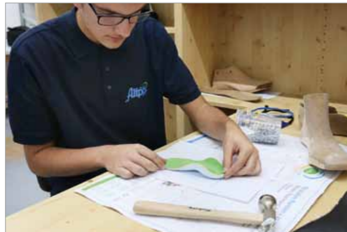
Prüfung einer Kinder-Schaleneinlage anhand des Blauabdrucks