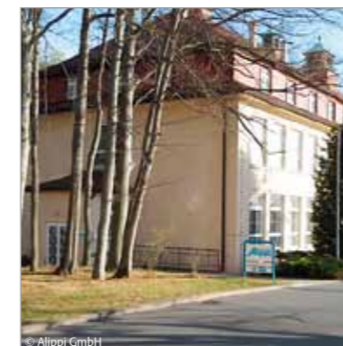
Vorstellung: Die Klinik-filiale im Zwickauer HKB

Für die nächste Ausgabe haben wir folgende Themen geplant. Das neue Heft erhalten Sie in unseren Filialen, beim Außendienstmitarbeiter oder der HomeCare-Schwester.