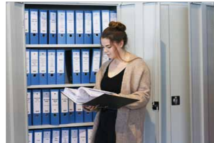
Die Rechnungen werden in Papierform im Archiv abgelegt.