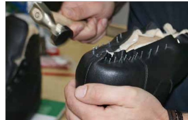
Verklopfen des Lederschaftes auf dem Leisten