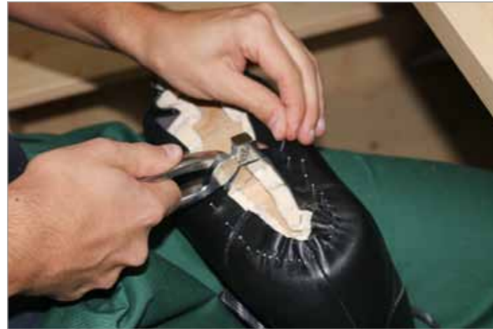
Zwicken des Schaftes eines Schuhs an die Bettung

Ein weiterer Schwerpunkt ist das Fertigen und Anpassen von Einlagen. Anhand verschiedener Abdrücke werden unterschiedliche Arten von Einlagen (Weichpolster, Schalen oder sensorische Varianten) individuell bearbeitet und angepasst. Und nicht nur dabei ist die Schleifmaschine ein unverzichtbares Werkzeug.