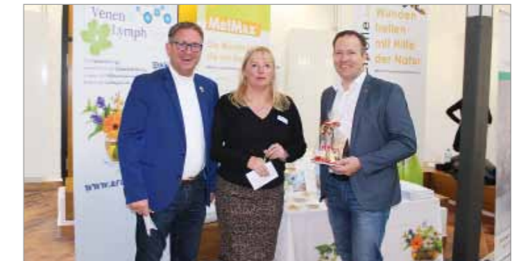
Zufriedene Aussteller und Organisatoren beim 11. Wundsymposium

Im großen Hörsaal der Westsächsischen Hochschule nahmen dann auch fast 300 Teilnehmer Platz, um den Fachvorträgen, die verschiedene Aspekte der Wundversorgung und -heilungsstörungen beleuchteten, zuzuhören. Aussagekräftige, praxisnahe und aktuelle Inhalte sowie engagierte Referenten zeichnen von Anfang an das Wundsymposium aus – so auch in diesem Jahr. Ein herzliches Dankeschön geht an die vielen Aussteller, die für den informativen und praktischen Teil während der Pausen sorgten: ohne sie wäre die Veranstaltung nicht realisierbar.