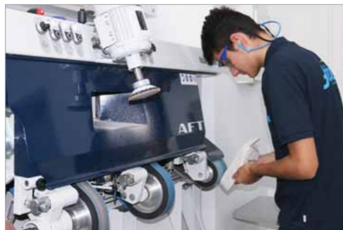
Arbeiten an der Schleifmaschine – immer mit Schutzausrüstung: hier wird eine Schuhsohle in Form gebracht.