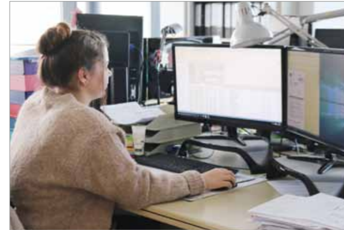
Das Buchen von Eingangsrechnungen erfolgt digital.