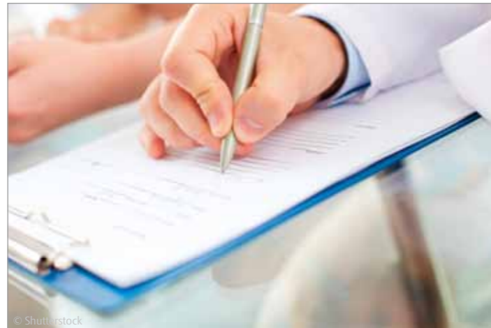
Akribische Datenaufnahme bei Pflegegutachten

Unterstützend stehen die Mitarbeiter auch in Fragen zur Pflegeberatung zur Seite. Sie begleiten Patienten und deren Familien bei der Entlassung aus der Klinik und sorgen für einen harmonischen Übergang in die tägliche Pflege. Wenn nötig und angefordert, erstellen sie unabhängige Pflegegutachten, die z. B. bei der Beantragung von Pflegeleistungen zum Einsatz kommen.