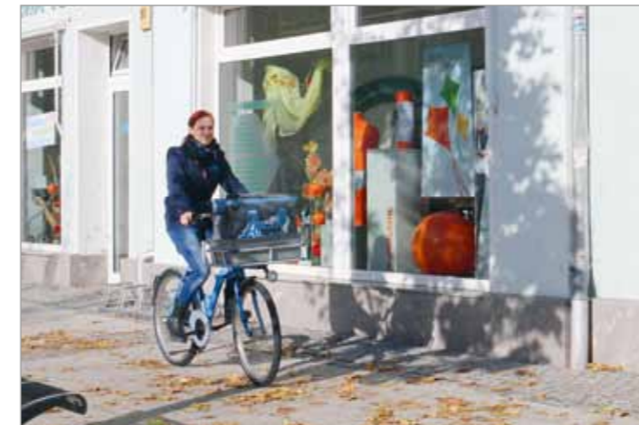
Das Auslieferungsfahrrad vor dem Delitzscher Fachgeschäft

Auf die innerstädtische Lage unserer orthopädischen Werkstatt in Delitzsch (Eilenburger Straße 61) haben sich die Mitarbeiterinnen und Mitarbeiter ganz besonders eingestellt. Die teils kurzen Wege zu Kunden bei Auslieferungen oder Hausbesuchen, in die