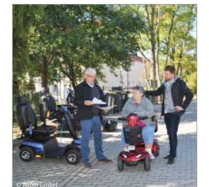
Bericht: Bundesweites Forschungsprojekt in Zwickau