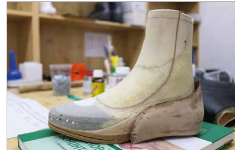
Fertiger individueller Geißleisten mit Hinterkappe