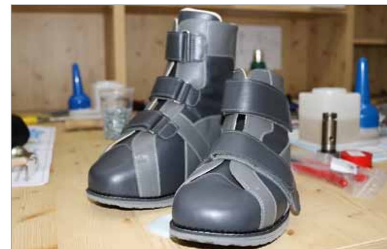
Ein komplett in Chemnitz gefertigtes Paar orthopädischer Maßschuhe vor der Übergabe an den Kunden

Maßnahmen der Füße die Daten auf den Blauabdruck übertragen werden. Zum Einsatz kommt nun der Leisten. Meist sind es Buchenholz-Rohlinge, es sei denn, die Füße sind so individuell, dass eine Gipsform erstellt und ein Leisten aus Kunststoff gefertigt wird. Auf den Rohling werden die Maße übertragen und er wird entsprechend in Form geschliffen. Dann erfolgt der Aufbau des Schuhs mit der Bettung. Der benötigte Schaft wird zentral in der Zwickauer Humboldtstraße per Hand gefertigt und dann auf den Unterbau, in dem noch der Leisten steckt, aufgezwickelt. Das ist das typische Bild, das wir vor Augen haben, wenn wir an das Schuhmacherhandwerk denken.