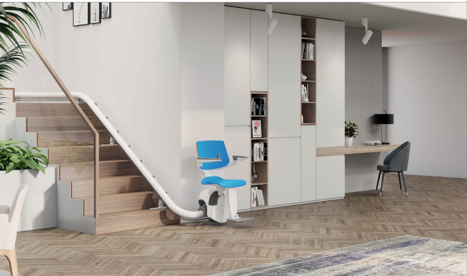
Das aktuelle Modell S-200, welches bereits mehrere Innovationpreise erhalten hat und seine Nutzer zuverlässig transportiert.

Es gilt folgendes zu bewerten: Wohn- oder Treppensituation, Anschaffung oder Finanzierung – in einer Checkliste finden Sie die wichtigsten Punkte zu Kauf und/oder Finanzierung des Trep-