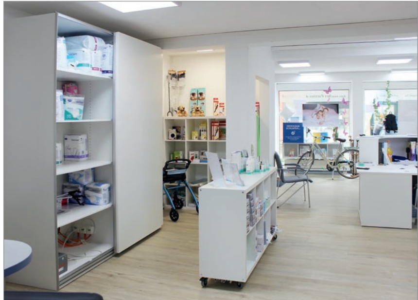
Das Geschäft ist unterteilt in die verschiedenen Versorgungsbereiche.

se durch die verschiedenen Sitzbereiche eine Wohlfühlatmosphäre für Kunden und Mitarbeiter.