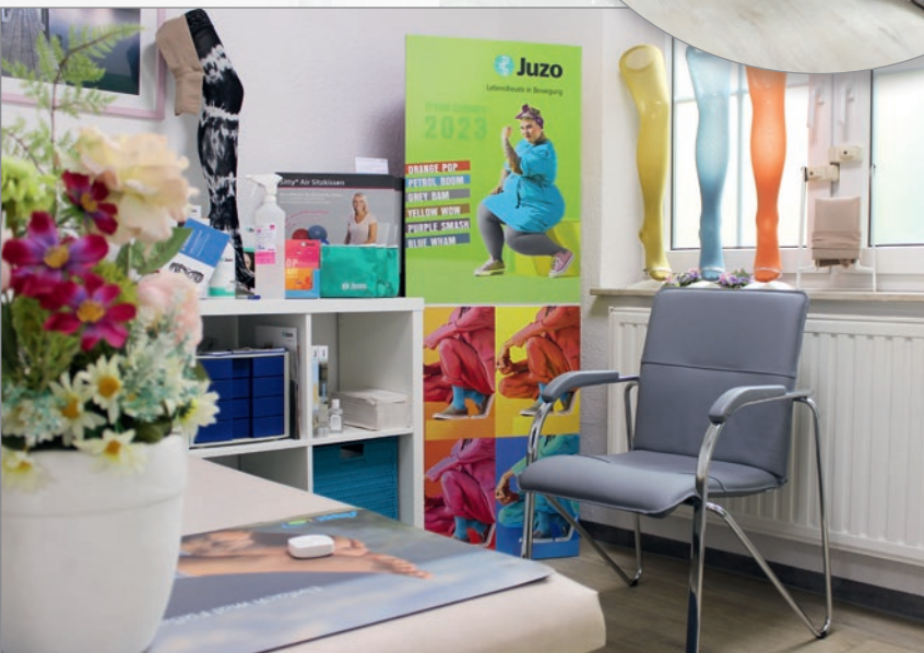
Die Kundenkabine im hinteren Teil der Filiale wird für Messungen und Beratungsgespräche genutzt.