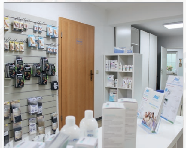
Unser Sortiment: übersichtlich und nach Anwendungsgebieten getrennt.

Als Besonderheit bieten wir in dieser Filiale eine große Vielfalt an Produkten für Allergiker an: Bettwaren, Bettwäsche, Spezialwaschmittel und Zusatzprodukte wie Handschuhe oder Schlafanzüge. Gern informieren wir Sie zu diesem Thema und über die verschiedenen Einsatz- und Anwendungsmöglichkeiten der Artikel. Auch helfen wir Ihnen, beim Kauf eventuell mögliche Zuschüsse bei Ihrer Krankenkasse zu erhalten.