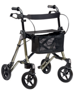
ID 234098 (Sepia), 225870 (Resedagrün)