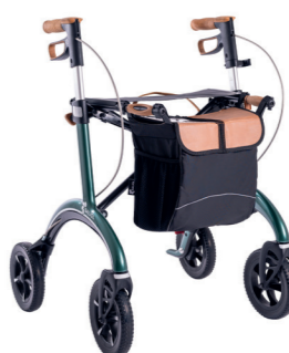
265102 (Blue, Gr. M), 264919 (Blue, Gr. L), 297241 (Green, M), 246180 (Green, Gr. L)