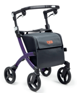
ID 276224 (Pebble White), ID 276225 (Matt Black), ID 276226 (Dark Purple), ID 276227 (Jungle Green)