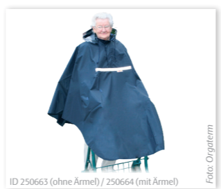
ID 250663 (ohne Ärmel) / 250664 (mit Ärmel)