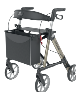
ID 277241 (Champagner), 277247 (Rot)