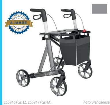
255846 (Gr. L), 255847 (Gr. M) Foto: Rehasense