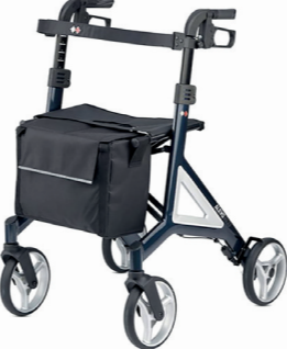
ID 302651 (Platin, Gr. L), 302653 (Platin, Gr. M), 302652 (Nachtblau Gr. L), 302654 (Nachtblau Gr. M)