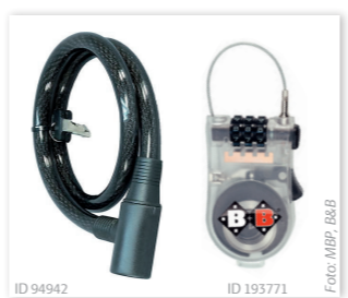
ID 94942 ID 193771