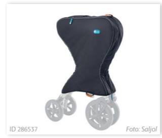
ID 286537