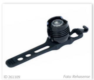
ID 261109