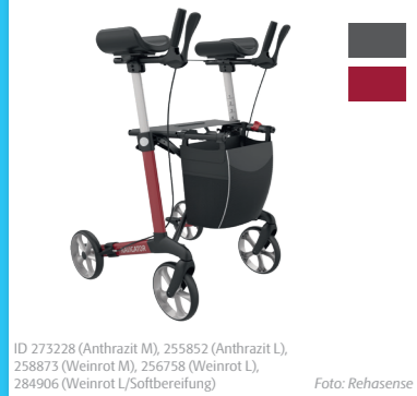
ID 273228 (Anthrazit M), 255852 (Anthrazit L), 258873 (Weinrot M), 256758 (Weinrot L), 284906 (Weinrot L/Softbereifung)