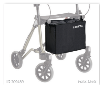
ID 209489