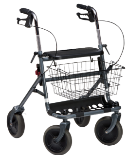
ID 277359