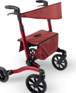
ID 302397 (Schwarz), 302398 (Forest Green), 302399 (Sequoia Red)