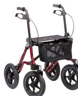
ID 225955