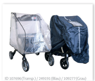
ID 107696 (Transp.) / 249191 (Blau) / 109277 (Grau)