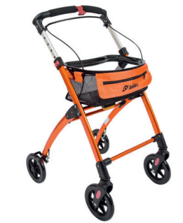
ID 241512 (Hellblau), 222122 (Orange), 271503 (Champagne)