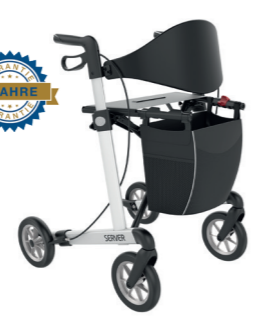
ID 225955