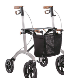
ID 286538