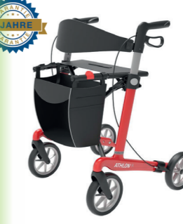
ID 255839 (Schwarz M), ID 255837 (Schwarz L), ID 255842 (Rot M), ID 255841 (Rot L)