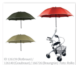
ID 126139 (Rotbraun) / 126140 (Graubraun) / 166726 (Braungrün)