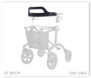
ID 286539