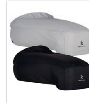
» Regendecke „Raindek“ und „Raindek long“ • verschiedene ID