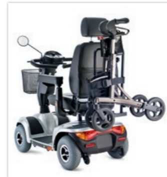
» Rollatorhalter • ID 290758, Standard • ID 290757, für LG-Rollator