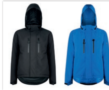
» Scooter-Jacke „QT Jacket“ • verschiedene ID