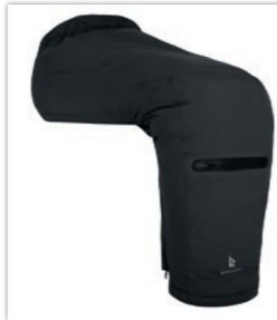
» Schlupfsack „Raindek Long Parka“ und „Raindek EXT“ • verschiedene ID