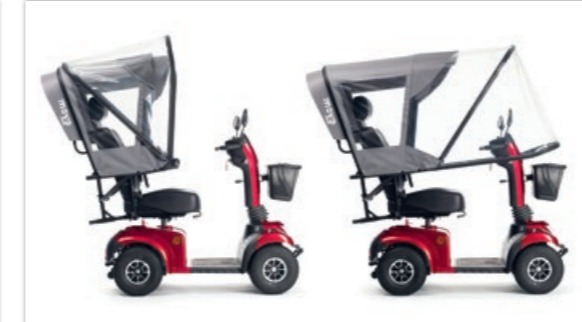
» Regenverdeck • ID 291025