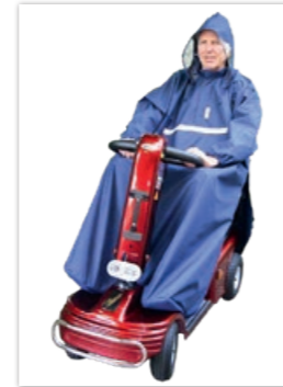
» Regencap • ID 250664, ohne Fußteil • ID 250665, mit Fußteil