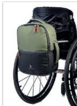
» Backrest Tasche • ID 289154