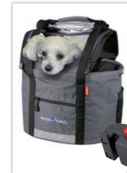
» Zubehörtaschen von KLICKfix