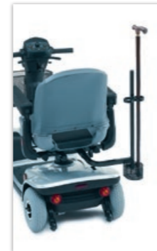
» Gehstockhalterung • ID 187344