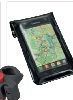
» Phonebag von KLICKfix inkl. Adapter • ID 256786, Größe M