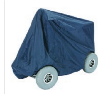
» Regenabdeckhaube • ID 250185